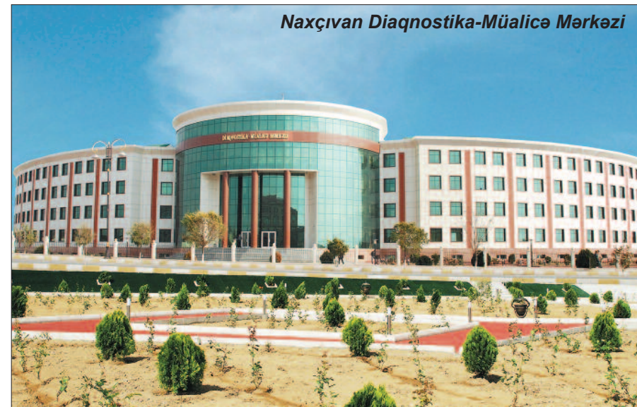
Naxçıvan Diaqnostika-Müalicə Mərkəzi

Naxçıvan Muxtar Respublikası Səhiyyə Nazirliyi dövlət proqramlarının icrasını əsas fəaliyyət istiqaməti kimi götürərək verilən tapşırıqların icrasını uğurla yerinə yetirir. Yoluxucu xəstəliklərin qarşısının alınması məqsədilə Gigiyena və Epidemiologiya mərkəzləri tərəfindən profilaktik və əks-epidemik tədbirlər mütəmadi olaraq davam etdirilir, su anbarlarında, mü-