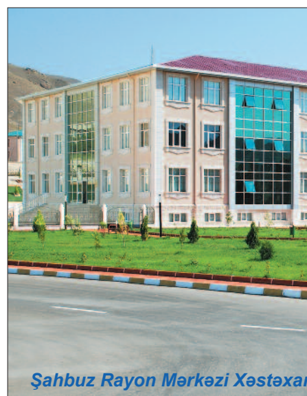
Sahbuz Rayon Mərkəzi Xəstəxanası

quruculuğu tədbirləri bu gün də davam etdirilir. Hazırda Naxçıvan Muxtar Respublika Xəstəxanasında yenidənqurma işləri aparılır, müasir tibbi avadanlıqlarla təchizat təmin edilir. Bu məqsədlə Azərbaycan Respublikası Prezidentinin 2014-cü il 11 aprel tarixli Sərəncamı ilə Azərbaycan Respublika-