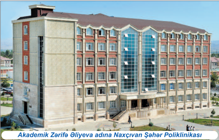
Akademik Zərifə Əliyeva adına Naxçıvan Şəhər Poliklinikası

su təchizatı qurğularında, ictimai, inzibati və digər binalarda, məişət suları axıdılan və tullantılar toplanan yerlərdə dezinfeksiya və dezinfeksiya işləri aparılır. Bu istiqamətdə görülən işlərin nəticəsidir ki, Ümumdünya Səhiyyə Təşkilatının müntəzəm monitorinqdə saxladığı əsas yoluxucu xəstəliklərə, o cümlədən salmonellyoz, bakterial dizenteriya, difteriya, epidemik parotit, pedikulyoz, malariya, leyşmanioz, poliomielit və tetanus kimi xəstəliklərə muxtar respublika ərazisində təsadüf olun-