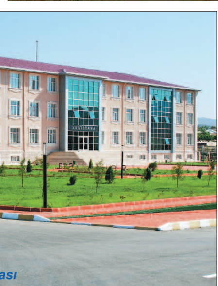
Sahbuz Rayon Mərkəzi Xəstəxanası

mur. Digər yoluxucu xəstəliklər isə əvvəlki illərlə müqayisədə xeyli azalmışdır.